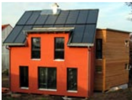
Das Sonnenhaus in Fürth, Vacher-Straße

Das Sonnenhaus-Institut veröffentlichte eine Diplom-Arbeit, die ein Standard-Haus, ein Sonnenhaus und ein Passivhaus miteinander vergleicht. Ausgewertet wurden nicht theoretische Berechnungen, sondern reale Daten von gebauten Häusern. Den Referenzfall – das Haus, das gerade die Energie-Einsparverordnung erfüllt, betrachten wir nicht genauer. Bei diesem Haus werden die Energiekosten in Zukunft eine so große Rolle spielen, dass niemand mehr so bauen wird. Aus Sicht der Baubiologie ist ein Passivhaus ein richtiger Ansatz, ein energetisch gutes Haus zu bauen. Einzig die Orientierung am Endenergie-Aufwand ist heute nicht mehr