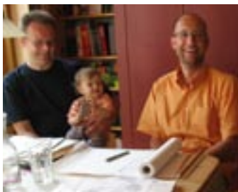
Beratung in familiärer Umgebung

Eine Baulücke gab es noch im Baugebiet „Heide“ in Veitsbronn. Der Gedanke des solaren Bauens mit Holz und Lehm begeisterte die Familie von Anfang an. Gifffreie und ökologische Baustoffe kombiniert mit einer sehr guten Energiebilanz und den daraus resultierenden niedrigen Heizkosten ergeben eine gute, in den Kostenplan eingepasste Mischung. Die schwere Bauweise – hier spielt der Lehm einen seiner vielen Vorteile aus – sorgt dabei noch für einen hervorragenden sommerlichen Wärmeschutz. Im Baugebiet waren Pultdächer bereits genehmigt worden. Das sich nach Süden öffnende Dach gibt im Obergeschoß Raum. Dadurch kann auf kompakter Hausgrundfläche von 8 auf 11 Metern ein großzügiger Raumeindruck entstehen. Die Dachneigung wurde so gewählt, dass ein einfacher Dachziegel möglich ist, über den wertvolles Regenwasser in die Zisterne mit Hauswasserwerk geleitet wird. Dadurch wird Versiegelung reduziert und es muss kein Trinkwasser ins WC gespült werden.