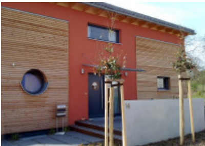
Ein Bullauge in Eingangstür und WC geben der Nordfassade einen eigenen Charme.

In Cadolzburg durften wir Familie Czichos in ihrem 2008 gebauten Haus besuchen (zwei Bilder rechts und oberes Bild links). Das Haus erhält ein Pultdach, hinter der großen Scheibe in der Mitte befindet sich eine Galerie-Ebene - nach Süden offen für Licht und Ausblick. Die Dachterrasse auf der Garage kann vom Bad aus begangen werden. Das Hauptdach ist begrünt. Das Haus hat eine Holz-Pellet-Heizung mit einem Kaminofen im Wohnzimmer zum Wohlfühlen.