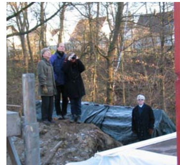
Ein Ereignis für die ganze Familie