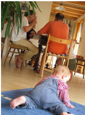
Zuerst will alles gut geplant