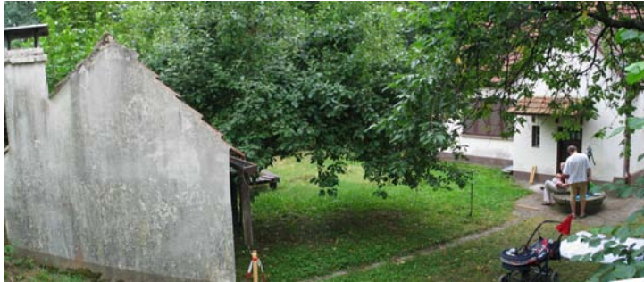
Am Anfang musste das alte Gebäude abgerissen werden