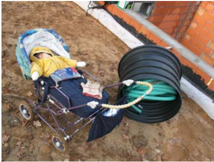
Ein echtes Baustellenkind