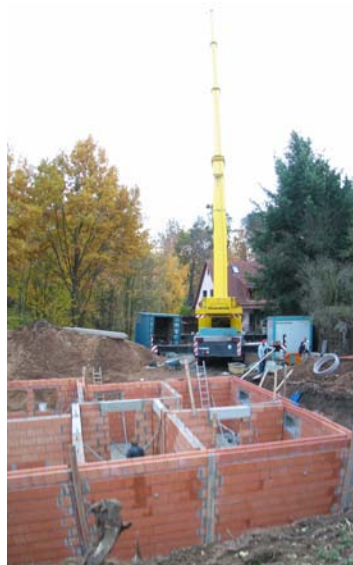
Der Fertigteil-Keller wird geliefert