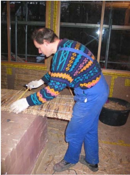
Schilfrohr-Dämmplatten als Lehmträger