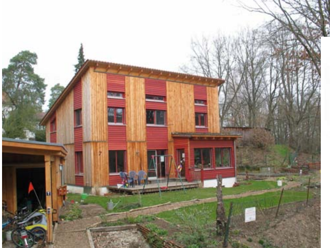
So sah das Haus in der Ausbauphase aus.

Haus der Familie Hillienhoff Zwiesel-grund 7 91126 Wolkersdorf